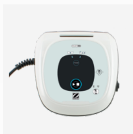
Boîtier de commande