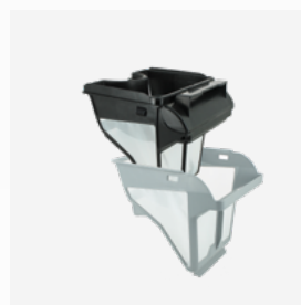
Bac filtrant Filtre double niveau : 150/60 µ