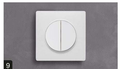
9 Votre produit est installé.