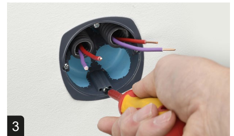
3 Fixer la boîte en serrant les vis verticales