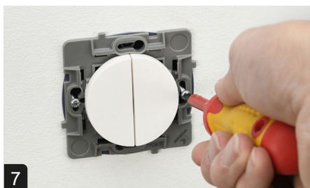
7 Ajuster et visser le mécanisme horizontalement