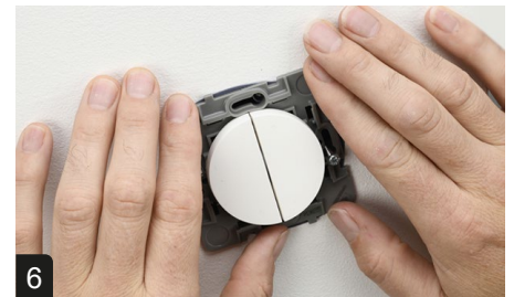
6 Poser le mécanisme en l'inclinant vers la gauche