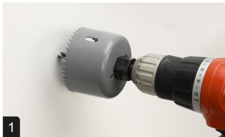
1 Percer le trou de boîte Diamètre 67mm