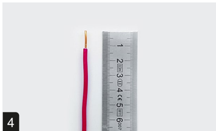
4 Dénuder les câbles à 13 mm