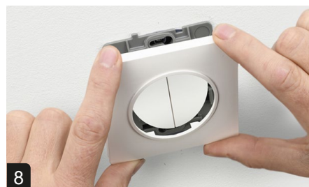
8 Clipper la plaque décor de finition