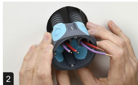
2 Installer la boîte d'appareillage ( griffes verticales )