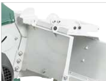
Carter de protection Safety cover