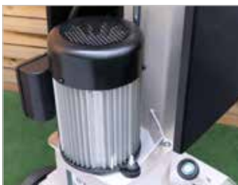
Moteur aluminium Aluminium motor