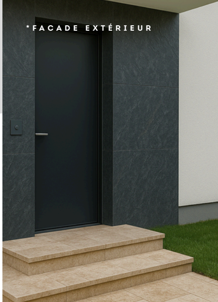
* FACADE EXTÉRIEUR